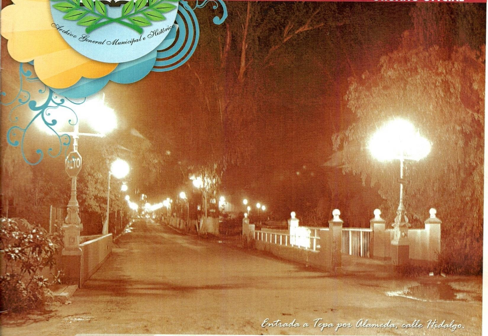
Entrada a Tepa por Alameda, calle Hidalgo.